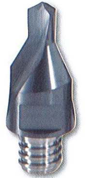
VDP***-02 センター穴加工用 2 枚刃（面取り刃付き）