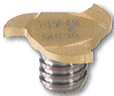
VST***-3 溝加工用 3 枚刃 溝幅：1.2 - 3.17 mm