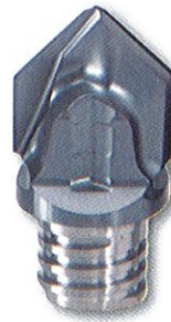
VCP***-02 センター穴、面取り加工用 2 枚刃