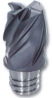
VEH*** スクエアタイプ 4 枚刃 汎用型